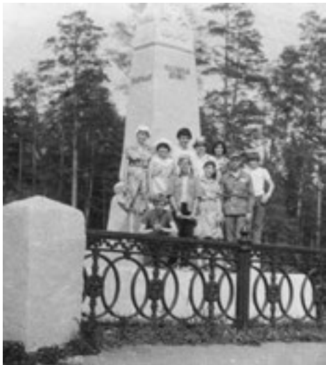
Участники географического кружка на границе Европы и Азии, начало 80-х