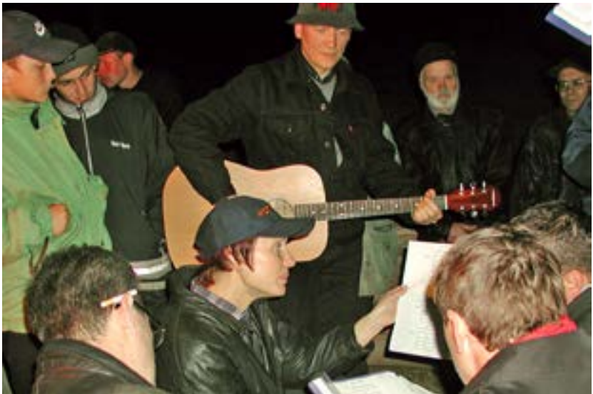
В походе, у костра 20 лет спустя...