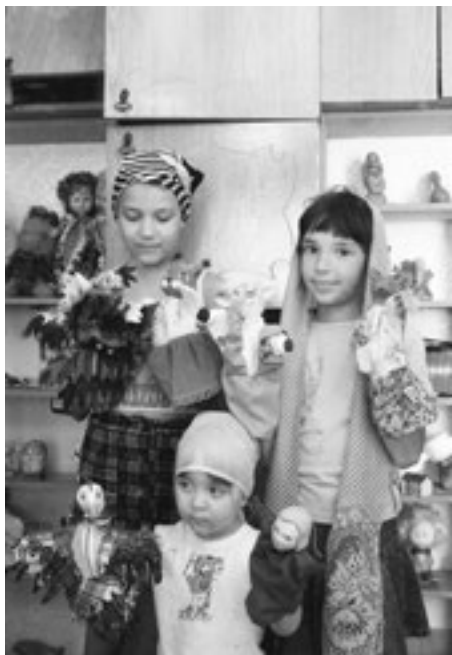
Воспитанницы воскресной школы в кружке кукольного театра. 2005 год