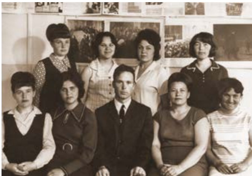
Педагогический коллектив Рекордской школы. Май 1972 года