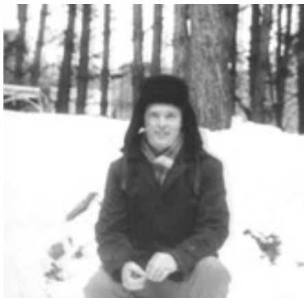
Прогулка в любимом парке, г. Набережные Челны, 1991 год

С папой мы много гуляли. Когда я подрос, он брал меня с собой на прогулки в лес, за грибами в Тарловку, Поспелово, учил премудростям походной жизни: как ориентироваться по солнцу и звёздам, когда грибы собирали, показывал, какие съедобные, а какие нет. Учил прислушиваться к лесу, как себя вести, если заблудишься. Собака у нас была, помесь лайки с дворнягой. Сначала думали, Дружок, оказалась Друза. Она с нами везде бегала. Любила с папой гулять.