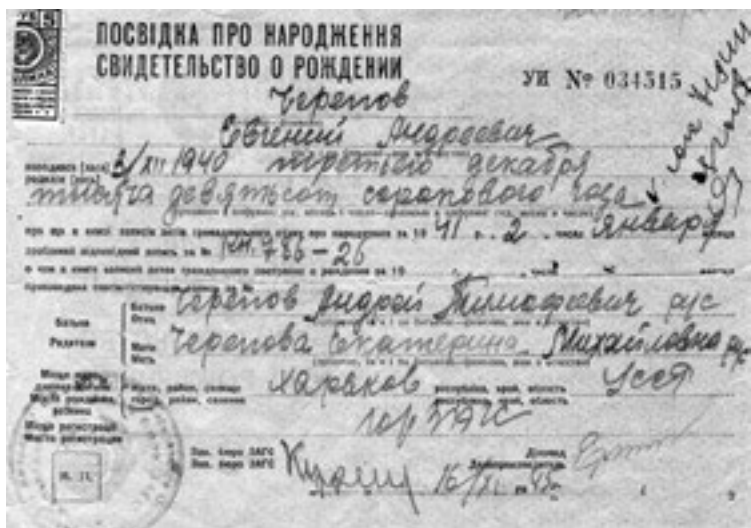
Свидетельство о рождении