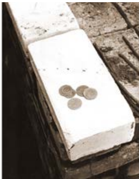
Чтобы будущие школьники учились на «пятерки», строители закладывали в углах стен школы пятаки