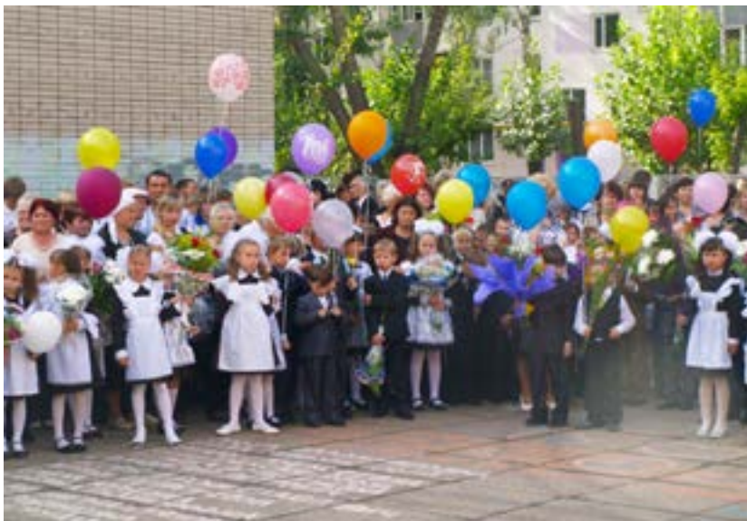
Здравствуй, школа № 20! 1 сентября 2011 года