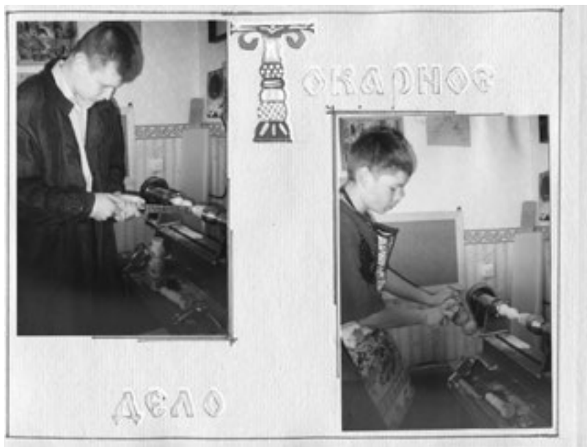
Фото из альбома-летописи. 2005 год