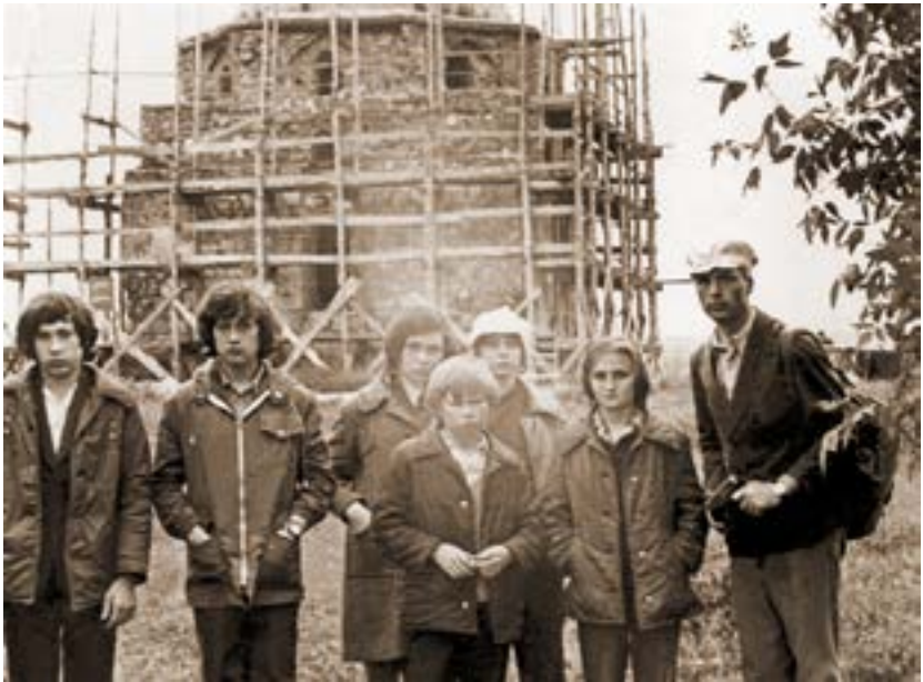
В походе. 1979 год