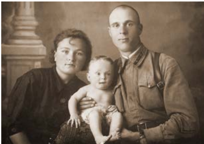
Харьков, июнь 1941 года, перед войной. Жене полгода