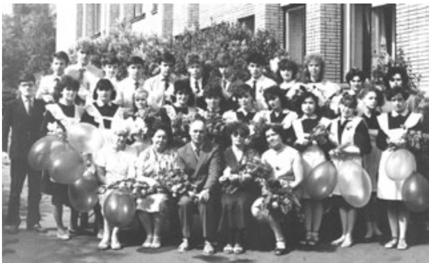
Последний звонок 10 «Б», 1987 год

Помню такой момент. Сразу после своего назначения он пришёл ко мне в кабинет, сказал: