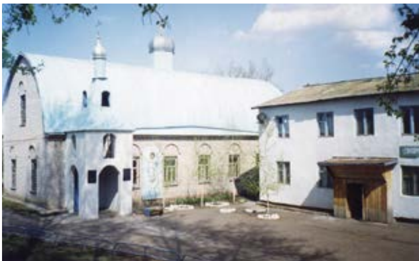
Свято-Тихоновская церковь и воскресная школа. 1995 год