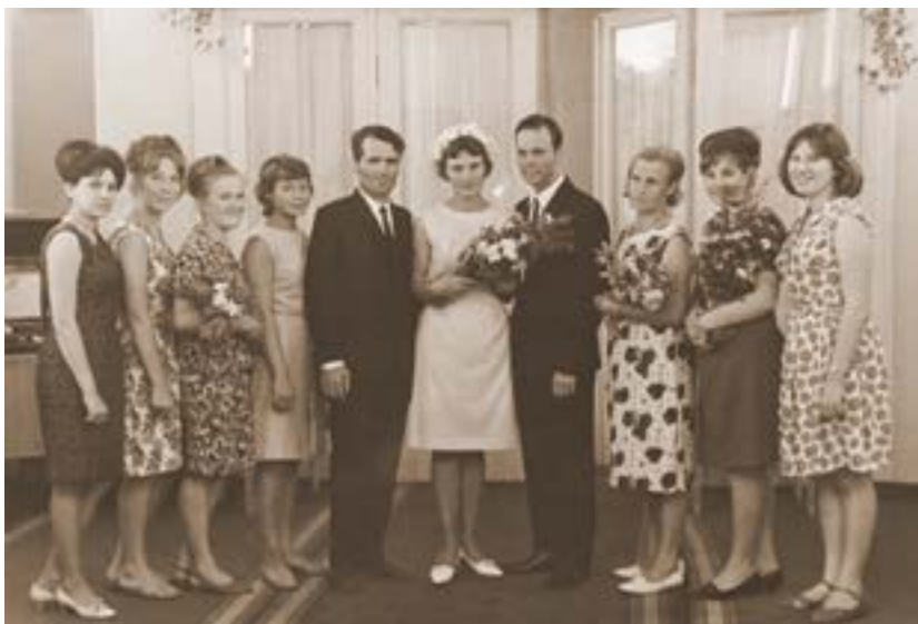
Свадьба. Сыктывкарский загс. 15 июля 1967 года