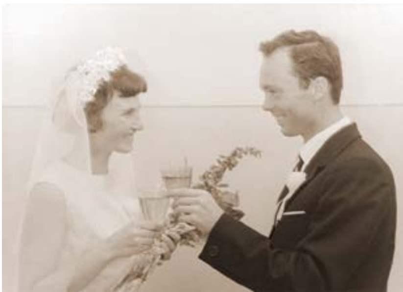
Свадьба. Сыктывкарский загс. 1967 год