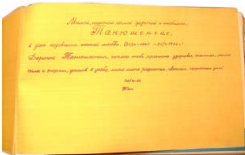
Фотоальбом, подаренный Евгением Татьяне