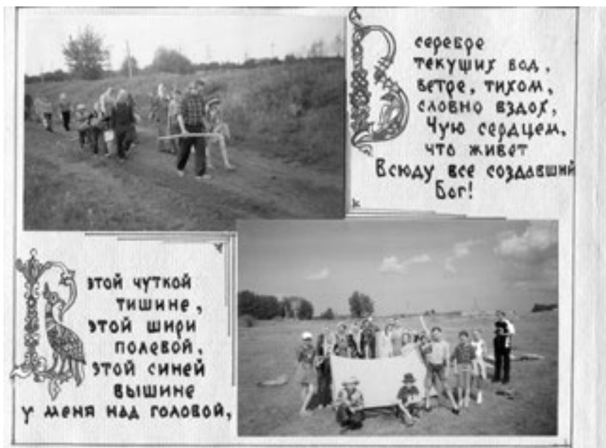
Страница из альбома-летописи воскресной школы, 2005 год