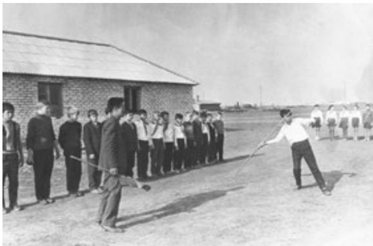
На спортивной площадке возле интерната для учащихся школы совхоза «Рекорд», 70-е

Да, тяжело было, но помнится только хорошее. Коллектив сплотился, дети — добрые, быстро сдружились. Классы — большие, доходило до двадцати пяти человек. К 1976 году построили новое школьное здание (Евгений Андреевич к тому времени уже уехал из Рекорда), наша школа получила статус средней.