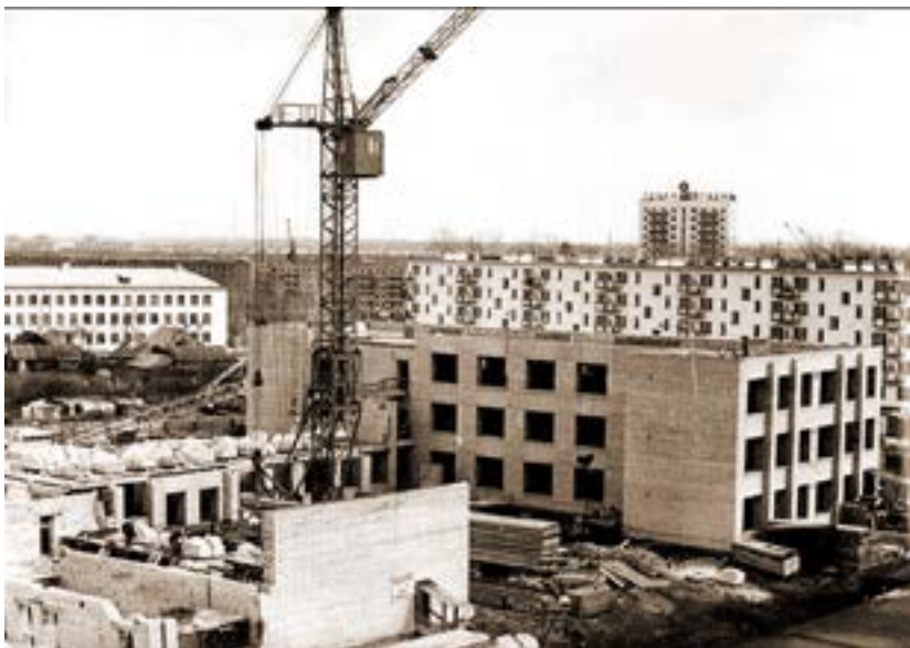
Строительство школы № 20